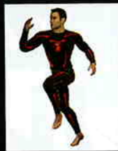
Skins™による段階的着圧

選り抜かれたアスリートを紹介して継続して試験を行うことにより、Skinsのバイオアクセレーションテクノロジーは、一定期間運動をした後すぐに起こる筋肉の疲労を減少させ、通常のレベルにより早く戻ることができるといった結果が出た。そのため、「疲労感の減少」「筋肉痛の緩和」「より早い回復」が体験できる